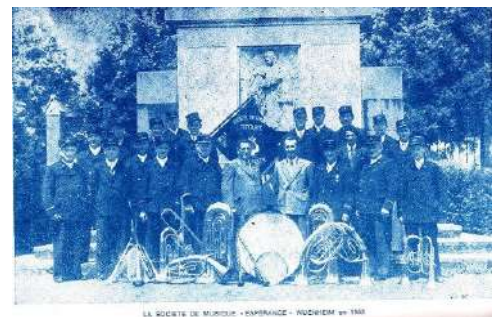
LA SOCIETE DE MUSIQUE - ESPERANCE - WUENHEIM en 1952

La Musique des Sapeurs-Pompiers puis La Société de Musique Espérance est devenue L'Orchestre d'Harmonie Espérance.