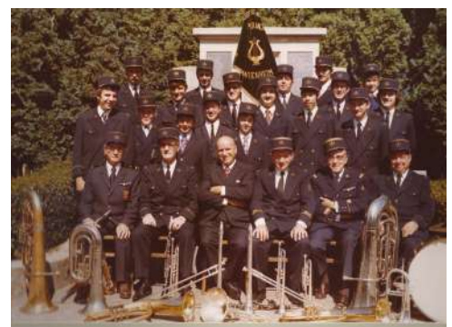
Société de Musique Espérance, 1973