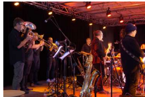
Le Groupe composé de 14 musiciens de l'OHE

La soirée s'est terminée sur le dancefloor avec le DJ Maxwell aux platines.