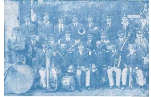
LA SOCIETE DE MUSIQUE A SES DEBUTS EN 1925